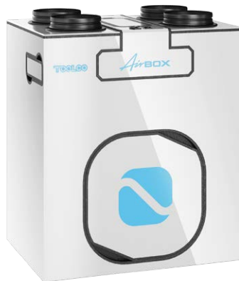
WG Biały Połysk