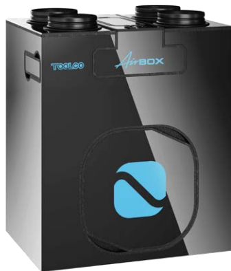
BG Czarny Połysk