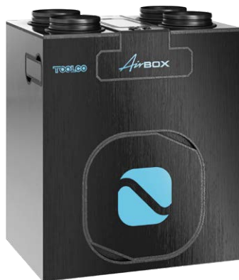
BB Czarny Szczotkowany