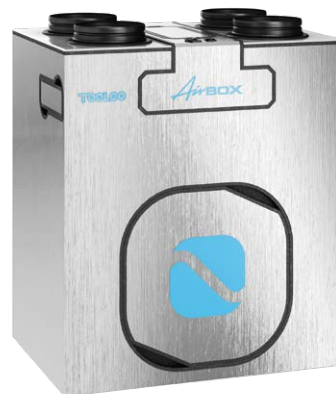
SB Srebrny Szczotkowany