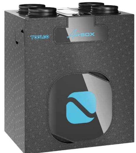
E-BG Skorupa widoczna + element Czarny